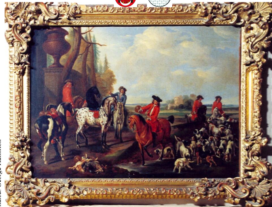
malba: George Hamilton

dovolujeme si Vás pozvat na Parforsní hony kolem zámků Kratochvíle a Třeboň za smečkou ASBACH FOXHOUNDS z Německa 6. až 8. dubna 2013